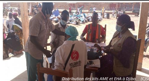
Distribution des kits AME et EHA à Djibo (C)SI

SI a conduit ses activités dans les régions du Centre-Nord, Nord et au Sahel. Au 1 er trimestre, 583 ménages ont été atteints en solutions d'abris d'urgence au Nord : à Barga (68 ménages), Koumbri (174 ménages), Ouahigouya (319 ménages), ainsi qu'au Centre-Nord à Namissiguima (22 ménages). En termes d'Articles Ménager Essentiels, 2 420 ménages en ont bénéficié dans 3 régions : Nord à Titao (296 ménages), Barga (116 ménages), Ouahigouya (910 ménages); Sahel à Djibo (742 ménages), et Centre-Nord à Rollo (356 ménages),