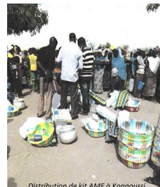
Distribution de kit AME à Kongoussi

UNICEF et partenaire SERACOM ont aussi assuré la distribution de 300 kits AME à 2234 personnes à Foubé, Centre Nord.