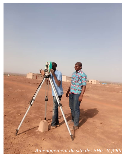
Aménagement du site des 5Ha

Il est prévu la réalisation de PDM pour l'assistance PAPAC II ainsi que le ciblage prévu de 160 PDI pour les abris d'urgence et 543 ménages PDI et communautés hôtes en AME à Titao.