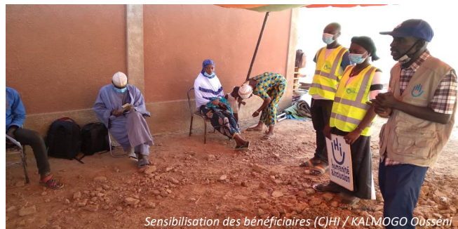
Sensibilisation des bénéficiaires