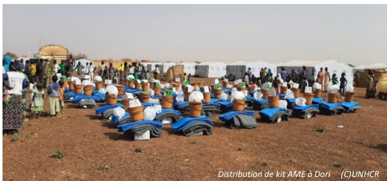
Distribution de kit AME à Dori

Au Nord, 70 ménages ont été atteints en distribution d'AME et 38 en abris d'urgence. Au Sahel, 902 abris d'urgences ont été construits dans plusieurs localités de la région ; dont 621 à Dori, 200 à Bani, 105 à Sebba, 153 à Gorom, 162 à Deou, 62 à Ourssi. 200 abris de type RHUs ont été installés au camp des réfugiés du Goudoubo au profit des réfugiés maliens. 127 kits d'AME complets distribués à Dori, Bani et