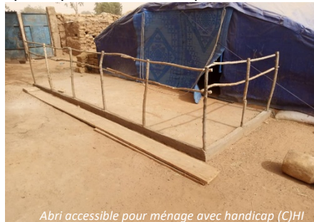
Abri accessible pour ménage avec handicap

Handicap International a concentré ses interventions au Sahel, dans la province du Soum, exactement à Djibo, où 250 ménages ont été assistés en solution d'abris d'urgence, 98 ménages en solution d'abris semi-durables et 378 ménages en Articles Ménager Essentiels. HI s'est positionné aussi pour combler le gap des ménages identifiés par SI dans le cadre du RRM qui étaient dans le besoin des abris et AME. A cet effet une vérification de la liste des bénéficiaires pour fin de mise à jour a été réalisée permettant d'identifier 61 ménages en besoin d'abri d'urgence et 85 ménages en terme d'AME. HI a également adapté 2 abris aux besoins spécifiques de leurs occupants en les rendant accessibles.