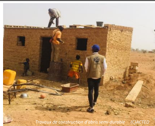
Travaux de construction d'abris semi-durables

602 abris semi-durables sont en cours de construction et planifiés dans les localités de Koussouka, Ouahigouya, Thiou au Nord et Barsalogo au Centre-Nord. La distribution d'AME à 454 ménages est prévue au Nord et au Centre-Nord.